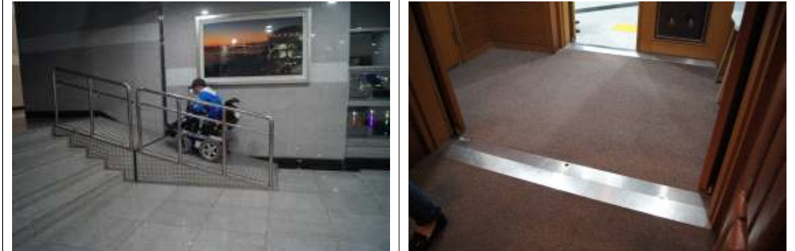
- 문화회관 내부 경사로나 설치돼 있고 턱이 없어 휠체어 이동이 용이함.