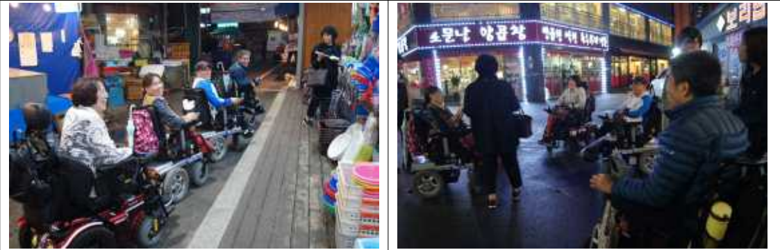
- 재래시장 근처 식당이 많이 있었으며 시장 내부이용에 어려움이 적음.