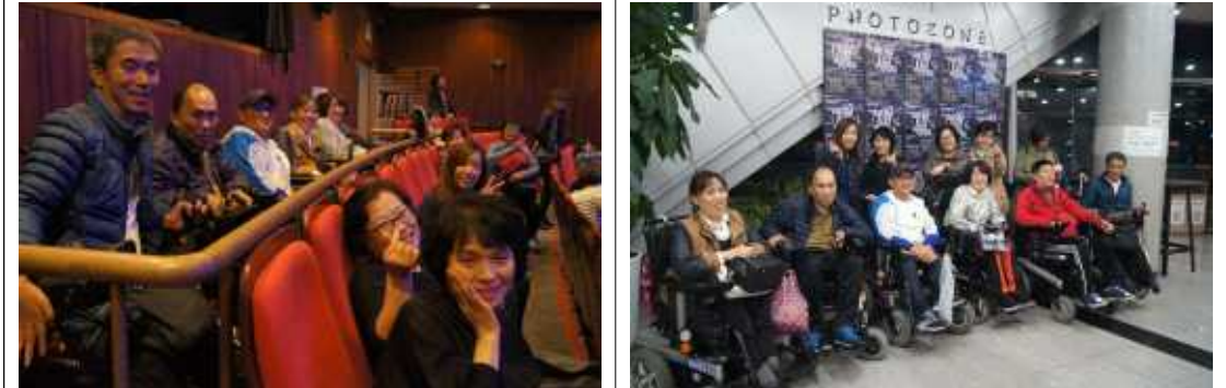
- 휠체어 좌석이 1층 맨 뒤쪽에 있고 공연관람에 무리가 없음.